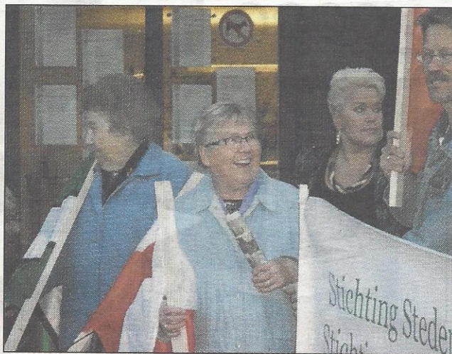
Enkele Wronki-vrijwilligers tijdens het stil protest voor het stadhuis.

BEVERWIJK - Zo'n twintig vrijwilligers van de Stedenband Beverwijk-Wronki hielden donderdag, voor het stadhuis, een stil protest, voorafgaande aan de raadsvergadering.