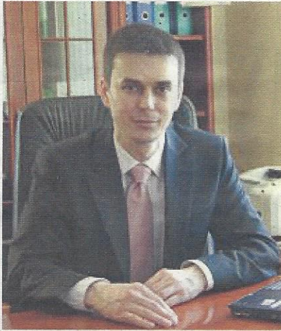
Burgemeester Mirek Wieczór

BEVERWIJK - Wronki heeft met verbazing kennisgenomen van het eenzijdig beëindigen van de stedenband door de gemeente Beverwijk. In een brief van 26 september (in het Nederlands!) aan de gemeenteraad, het college van B & W en de burgemeester van Beverwijk, schrijft Wronki de officiële banden met Beverwijk te willen behouden.