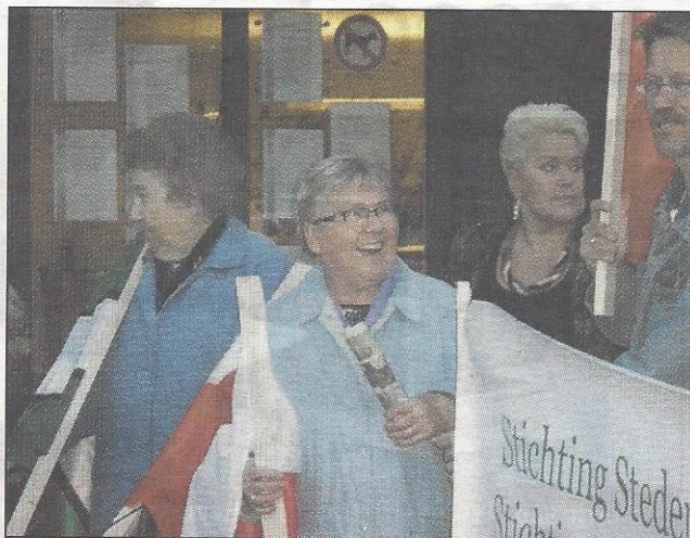
Enkele Wronki-vrijwilligers tijdens het stil protest voor het stadhuis.

BEVERWIJK - Zo'n twintig vrijwilligers van de Stedenband Beverwijk-Wronki hielden donderdag, voor het stadhuis, een stil protest, voorafgaande aan de raadsvergadering.